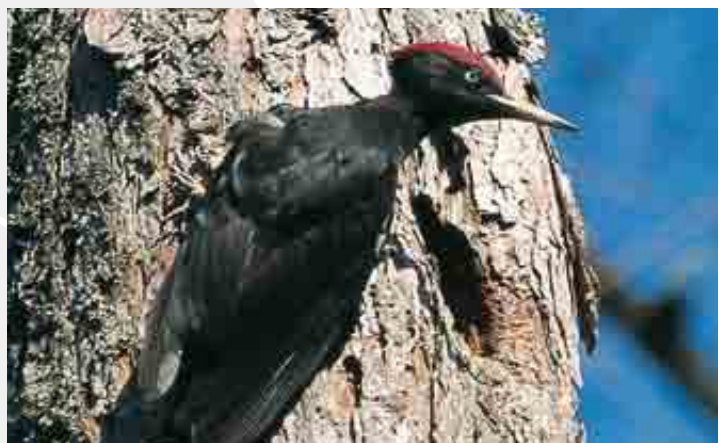
Picchio nero ( Dryocopus martius )