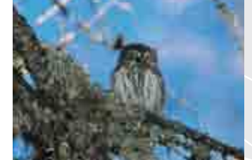
Civetta nana ( Glaucidium passerinum )

Anche gli ungulati, come cervi, caprioli e camosci, sono presenti nel SIC, oltre a numerose altre specie di mammiferi come marmotte, tassi e ricci.