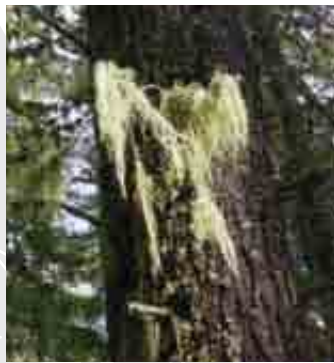
Barba di bosco ( Usnea sp.)

Un'altra pianta molto interessante è la digitale ( Digitalis lutea ), dai fiori tubulari gialli; le piante di questo genere contengono alcune sostanze che riducono la frequenza del battito cardiaco. Si tratta di piante utili, ma pericolose: una dose eccessiva può portare alla morte, e non è facile dosare la sostanza attiva presente nella pianta.