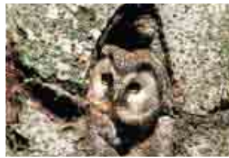
Civetta capogrosso ( Aegolius funereus )

La Val Cervia possiede una notevole ricchezza faunistica. Vi nidificano il picchio nero, la civetta capogrosso e la civetta nana, tre specie di uccelli che condividono la predilezione per gli ambienti di foresta in cui possono trovare alberi di medie e